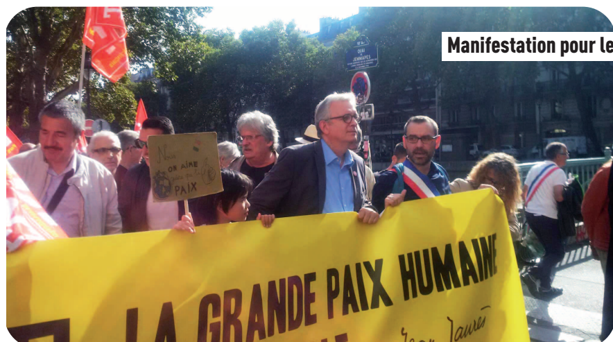
Manifestation pour le désarmement nucléaire