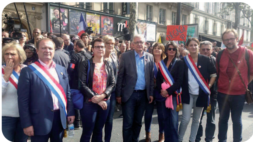
Délégation du PCF au rassemblement à l'appel de la FI.